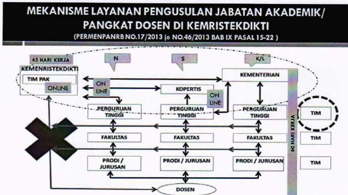
Gambar 1. Mekanisme Layanan Pengusulan Jabatan Akademik/Pangkat Dosen

Kenaikan jabatan akademik/pangkat dosen merupakan bagian tidak terpisahkan dengan pengembangan karir dosen, dengan demikian mekanisme penilaian dan proses kenaikan jabatan akademik/pangkat dosen akan diintegrasikan secara online (daring). Dengan sistem daring diharapkan dapat meningkatkan efisiensi layanan dan mendukung prinsip-prinsip penilaian, sebagaimana pada Gambar 1.